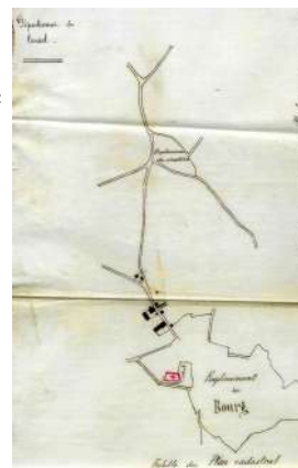
Plan du cimetière réalisé par l'instituteur adjoint M Souhbayre le 25 novembre 1893

C'est en 1886, le 20 juin, qu'est votée la translation du cimetière conformément au décret du 23 prairial an XII. Le transfert est prévu au lieu appelé la Seitéraie appartenant à la commune.