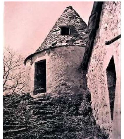
La tour ronde