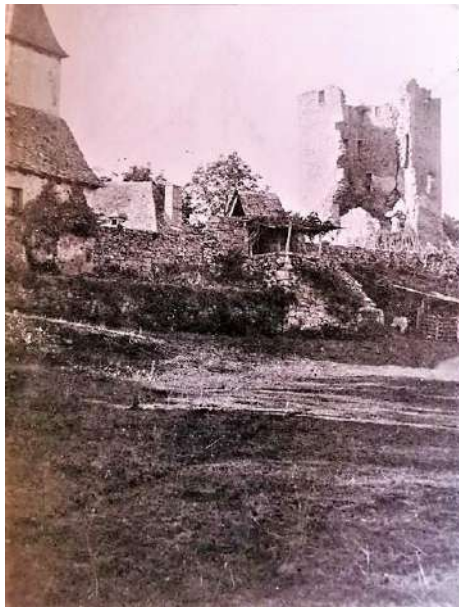
Les ruines du donjon

Une nouvelle enceinte a été édiflée encore plus à l'ouest enveloppant les bâtiments d'exploitation : tour ronde XVI-XVII ème siècle, le four, la chapelle Sainte Madeleine (XIV).