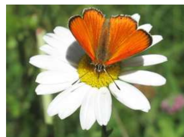
La biodiversité est aussi notre cheval de bataille...

sympathisant enrichit l'association de sa personnalité, de ses idées, de ses connaissances, de son expérience et surtout de son énergie.