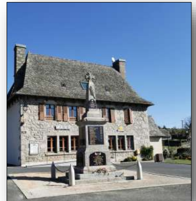
Place Céline Esquiroir - Ladinhat

Ce journal vous est proposé gratuitement mais si vous voulez contribuer vous trouverez au dos de ce numéro, un bulletin d'adhésion. L'adhésion c'est soutenir nos actions, c'est aussi, pour ceux qui le souhaite, donner de son temps,