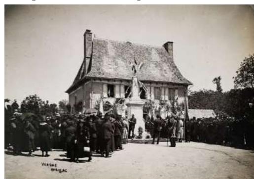
Inauguration du monument aux morts de Ladinhat

oublions pas, ce monument : un simple jaillissement de pierres, un prodige d'équilibre est pour nous une